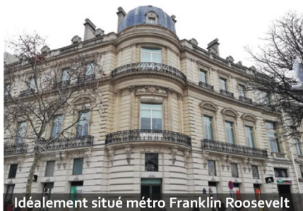
Idéalement situé métro Franklin Roosevelt

Cela fait vingt-cinq ans que je travaille dans le conseil en investissements : j'ai lu de nombreux témoignages sur les basketteurs américains ruinés moins de 10 ans après avoir pris leur retraite... Je me suis rendu compte que les mêmes déconvenues arrivent aussi aux footballeurs professionnels en France. Les erreurs observées sont toujours les mêmes : ne pas provisionner ses impôts, ne pas épargner de manière conséquente lorsque les revenus le permettent, favoriser de grosses dépenses de loisirs sans penser aux lendemains, faire des